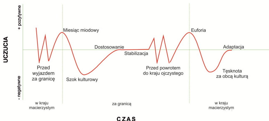
Rys. 2. Fazy procesu akulturacji

Źródło: M. Bartosik-Purgot, Otoczenie w biznesie międzykulturowym , PWE, Warszawa 2006, s. 179.